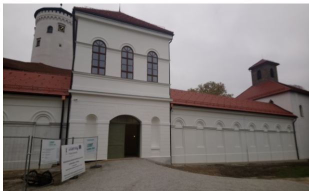
Považské Muzeum w Budatínie po remoncie