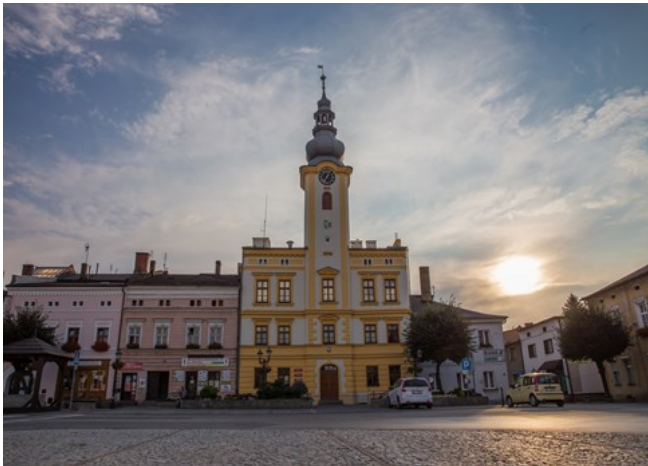
Obnovv sa dočkala fasáda radnice.

OBDOBIE REALIZÁCIE: marec 2017 – október 2018