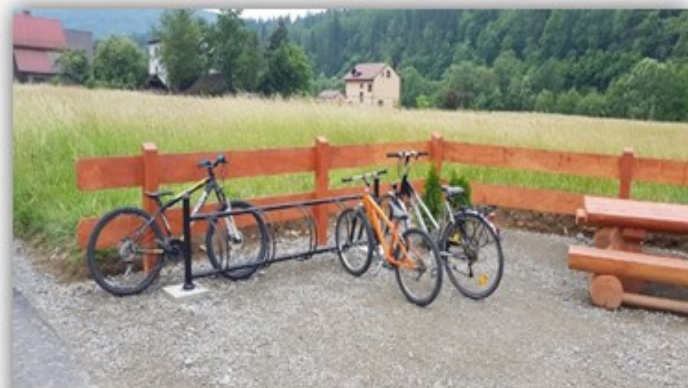
Zatoka dla rowerów, miejsce odpoczynku

TERMIN REALIZACJI PROJEKTU: listopad 2016 r.– październik 2018 r.