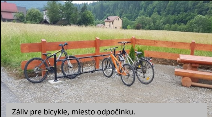
Záliv pre bicykle, miesto odpočinku.

OBDOBIE REALIZÁCIE: november 2017 – október 2018