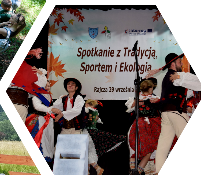
Zdjęcie z projektu: Wspólna ochrona dziedzictwa kulturowego i przyrodniczego Gmin Nová Bystrica i Rajcza