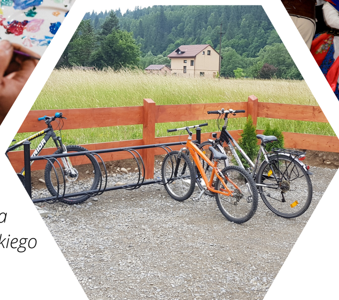
Zdjęcie z projektu: Budowa transgranicznej polsko-słowackiej trasy turystycznej