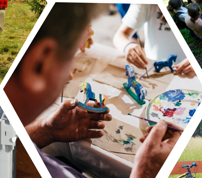
Zdjęcie z mikroprojektu: TransEtno – spotkania z tradycją polsko-słowackiego pogranicza