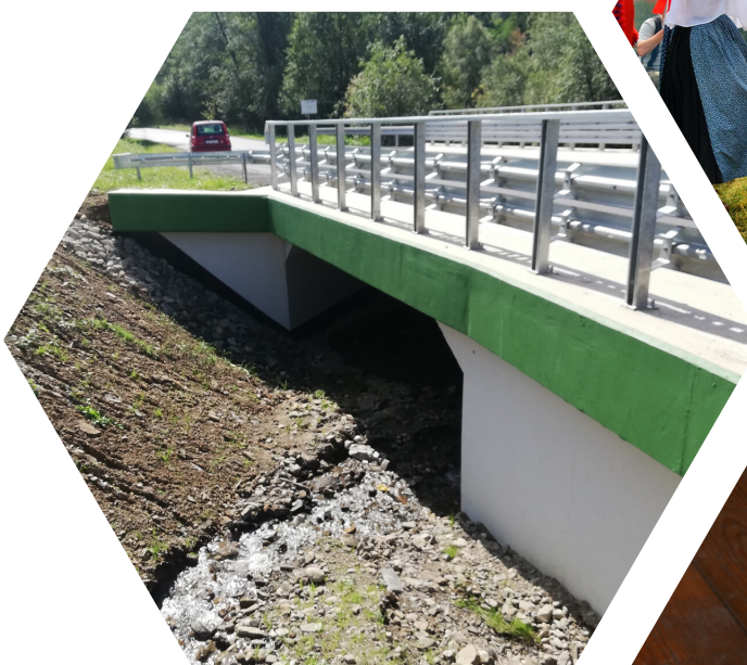
Zdjęcie z projektu: Lepsze połączenia z siecią TEN-T szansą rozwoju Powiatu Żywieckiego i Powiatu Čadca, most w Soli