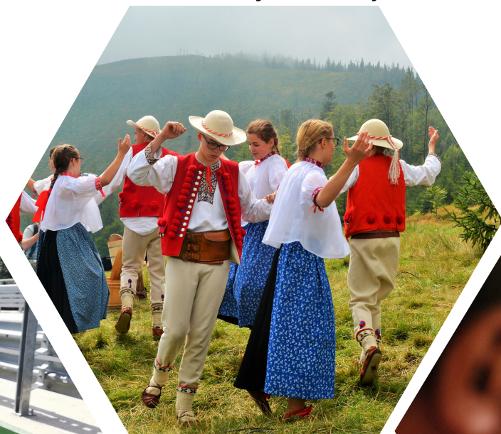
Zdjęcie z projektu: Szlak Kultury Wołoskiej