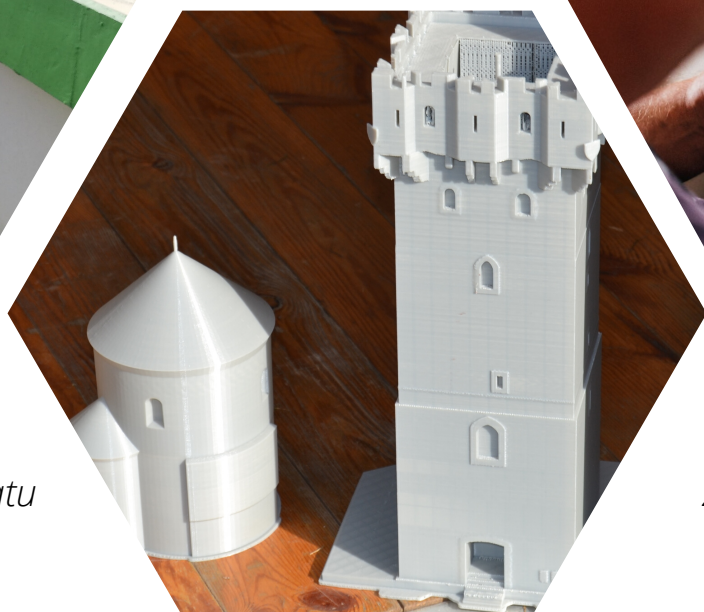
Zdjęcie z projektu: Wspólnadigitalizacja 3D obiektów historycznych obszaru transgranicznego SK-PL