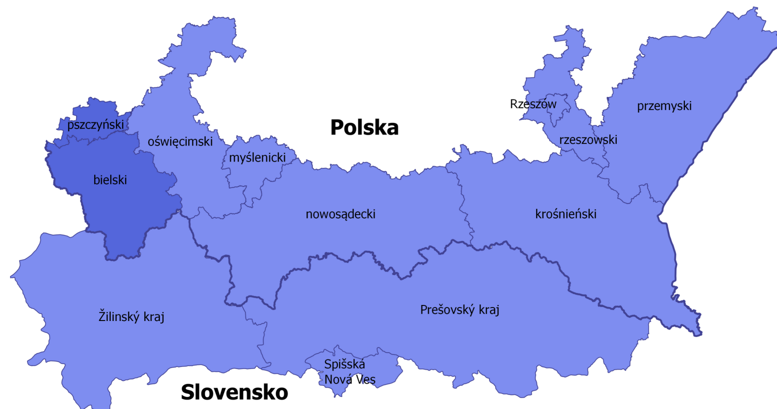
Mapa obszaru wsparcia Programu

Projekty w Programie realizowane są wspólnie przez polskich i słowackich partnerów, których główną działalnością nie jest działalność o charakterze komercyjnym. Partner wiodący i partnerzy projektu co do zasady powinni pochodzić z obszaru kwalifikującego się w Programie, ale mogą też pochodzić spoza tego obszaru, o ile ma to uzasadnienie z punktu widzenia celów projektów oraz o ile projekt realizowany jest na obszarze wsparcia lub przynosi mu korzyść.