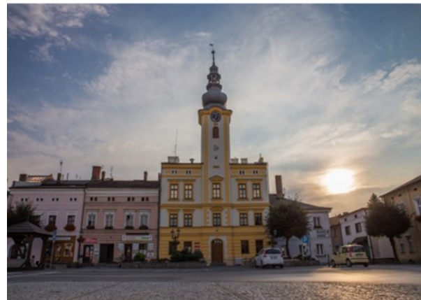
Obnovy sa dočkala fasáda radnice