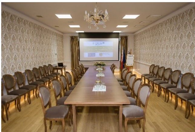
Wnętrze sali multimedialnej

Projekt nawiązuje do wcześniejszej współpracy partnerów, dzięki której w piwnicach Ratusza w Strumieniu powstała galeria „pod Ratuszem” oraz zagospodarowano przestrzeń wokół Zamku w Budatynie i otaczający go park. Kontynuacja współpracy przyniosła kolejne efekty. Zabytkowy Ratusz w Strumieniu został odnowiony, a w jego pomieszczeniach powstała sala multimedialna. Wyremontowane pomieszczenia budynku gospodarczego przy Zamku w Budatynie przeznaczono na ekspozycję rzemiosła druciarskiego. Działania podejmowane w ramach projektu, np.: Polsko-Słowackie Dni Rzemiosła w Budatynie, Międzynarodowy Dzień Tradycji w Strumieniu, powstanie aplikacji mobilnej zawierającej informacje na temat zabytków kultury i wydarzeń w regionie pogranicza, wydanie publikacji prezentującej najciekawsze miejsca na terenie Gminy Strumień i Kraju Żylińskiego, pozwalają wzmocnić tożsamość kulturową i społeczną oraz stworzyć ofertę pozwalającą na interesujące spędzanie wolnego czasu.