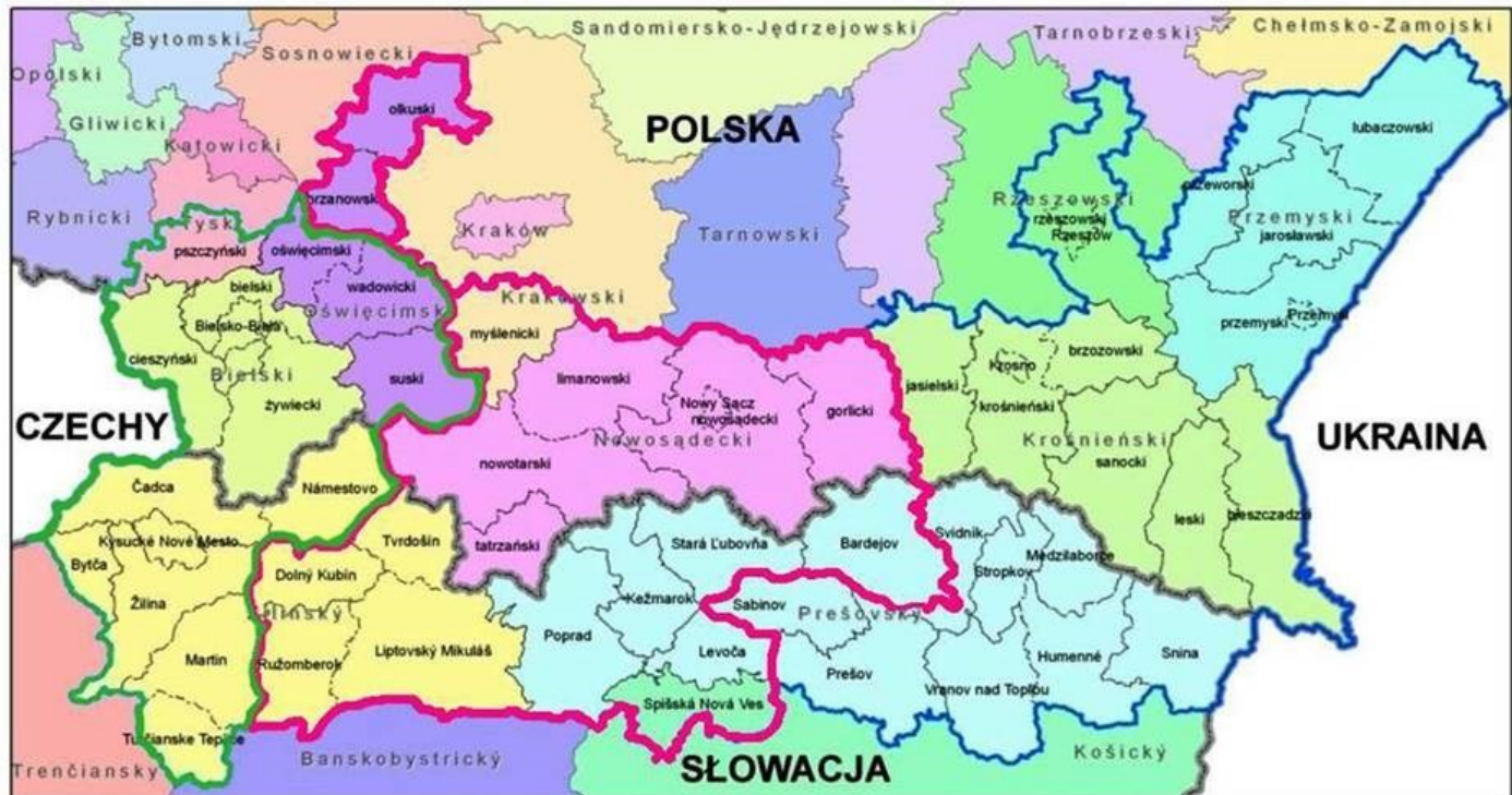
Mapa obszaru wsparcia projektów parasolowych w ramach Programu Interreg V-A Polska-Słowacja 2014-2020

Wnioskodawcy (w tym PW mikroprojektów wspólnych) składają wnioski o dofinansowanie do właściwego obszarowo PW PP lub PPP w terminie i zgodnie z zasadami ogłoszonego naboru.