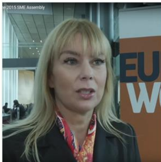
SME Assembly - Growth - European Commission

"The SME Assembly" is the most significant event for small and medium-sized enterprises (SMEs) in Europe. The conference takes place once a year during the European SME Week. Together with the network of SME Envoys, the assembly creates the governance structure of the Small Business Act. The 2016 SME Assembly will take place in Bratislava on 23 - 25 November 2016. The conference will be the flagship event of European SME Week. Entry to the SME Assembly and European Enterprise Promotion Awards is by personal invitation from the European Commission only. If you would like to join, you can register your interest here: https://ec.europa.eu/.../b.../small-business-act/sme-assembly_en