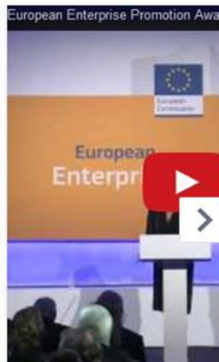
SME Assembly - Growth - European Commission