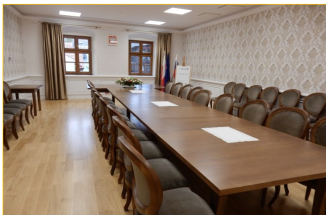
Sala multimedialna w Ratuszu

Współpraca partnerów zaowocowała kolejnymi przedsięwzięciami. W ramach II etapu projektu zrealizowanego w ramach środków Interreg Polska - Słowacja zmodernizowane zostały zabytki kultury: Ratusz w Strumieniu – najstarszy Ratusz na Śląsku i budynek gospodarczy przy zamku w Budatynie. Zakres prac w Strumieniu objął odnowienie elewacji ratusza, renowacji została poddana drewniana stolarka okienna, wymieniono także obróbkę blacharską oraz pokrycie dachowe. Całkowicie została odnowiona sala sesyjna, zmieniając swój wygląd i funkcjonalność.