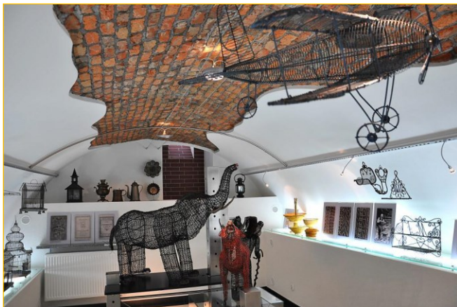
Galeria pod Ratuszem

Etap 2 Projektu pn. „Budatín - Strumień: współpraca na pograniczu” nawiązywał do współpracy Partnerów z poprzedniego okresu programowania, kiedy w ramach wspólnego projektu w Strumieniu piwnice ratuszowe zaadoptowane zostały na „Galerię Pod Ratuszem”, a po stronie słowackiej zagospodarowano park zamkowy i przestrzeń wokół Zamku w Budatynie.