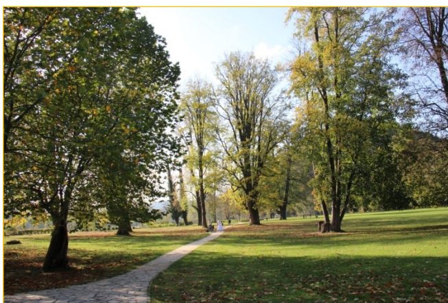
Zrewitalizowany Park Zamkowy w Budatynie

Współpraca partnerów zaowocowała kolejnymi przedsięwzięciami. W ramach II etapu projektu zrealizowanego w ramach środków Interreg Polska - Słowacja zmodernizowane zostały zabytki kultury: Ratusz w Strumieniu – najstarszy Ratusz na Śląsku i budynek gospodarczy przy zamku w Budatynie. Zakres prac w Strumieniu objął odnowienie elewacji ratusza, renowacji została poddana drewniana stolarka okienna, wymieniono także obróbkę blacharską oraz pokrycie dachowe. Całkowicie została odnowiona sala sesyjna, zmieniając swój wygląd i funkcjonalność.