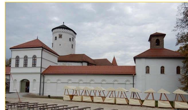
Zmodernizowany budynek gospodarczy przy zamku w Budatynie

Budynek gospodarczy przy zamku w Budatynie od dawna był nieczynny ze względu na zły stan techniczny. Modernizacja pozwoliła go udostępnić i w wyremontowanych pomieszczeniach stworzyć ekspozycję rzemiosła druciarskiego w jego tradycyjnej i artystycznej formie.