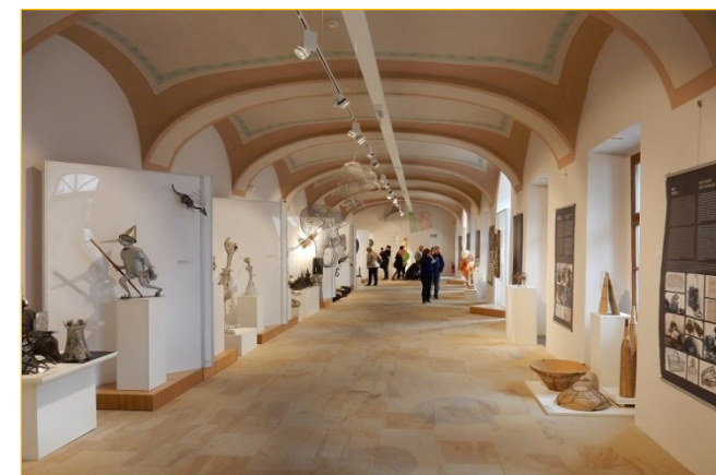
Ekspozycja rzemiosła druciarskiego w zmodernizowanym budynku gospodarczym w Budatynie

Dzięki realizacji projektu powstała aplikacja mobilna zawierająca informacje na temat zabytków kultury i wydarzeń w regionie pogranicza. Aplikacja dostępna jest pod adresem: