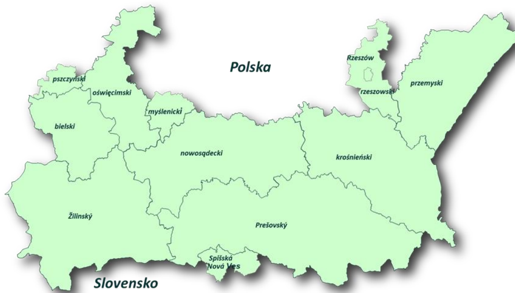
Obszar wsparcia programu Polska-Słowacja.

Rok 2018 był czasem intensywnej realizacji programu oraz ważnym etapem na drodze do osiągnięcia zakładanych celów. Jego kluczowymi zadaniami jest ochrona, promowanie i rozwój zasobów środowiska i dziedzictwa kulturowego. Ze środków programu wspierana jest też modernizacja i rozbudowa infrastruktury drogowej usprawniającej komunikację między Polską a Słowacją oraz dostosowanie edukacji zawodowej do wymogów transgranicznego rynku pracy. Na realizację zadań w tych trzech obszarach tematycznych przeznaczono 169,3 mln euro z Europejskiego Funduszu Rozwoju Regionalnego.