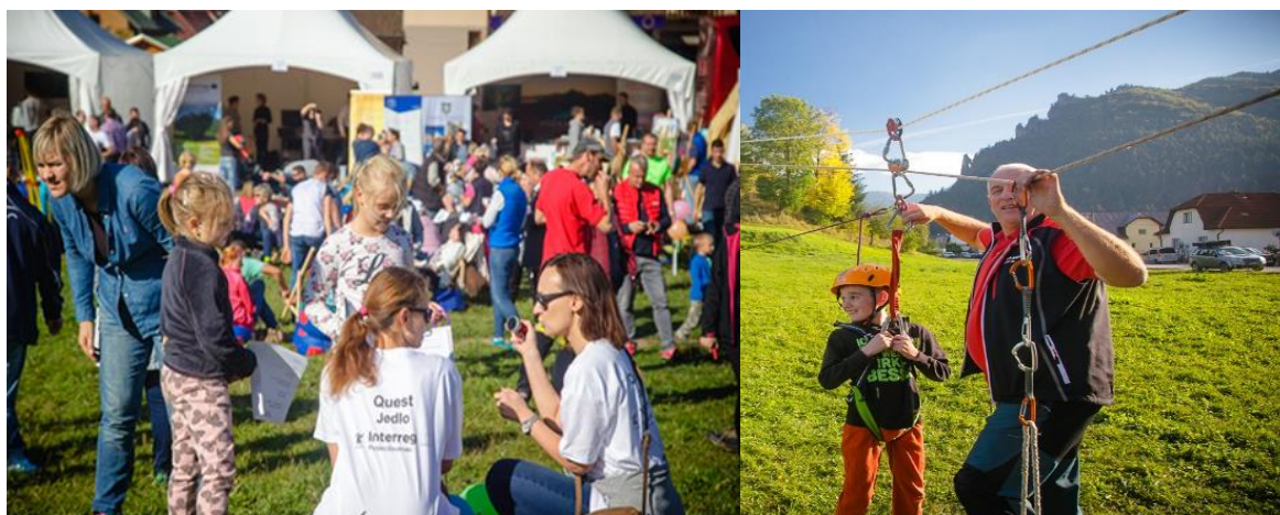
Na zdjęciach wydarzenie roczne programu w Terchovej, 6.10.2018.

ratowników górskich, którzy prezentowali jak zdrowo i bezpiecznie korzystać ze szlaków w górach. Uczestnicy mogli także skorzystać ze strefy relaksu, a chętni oglądali filmy o Janosiku.