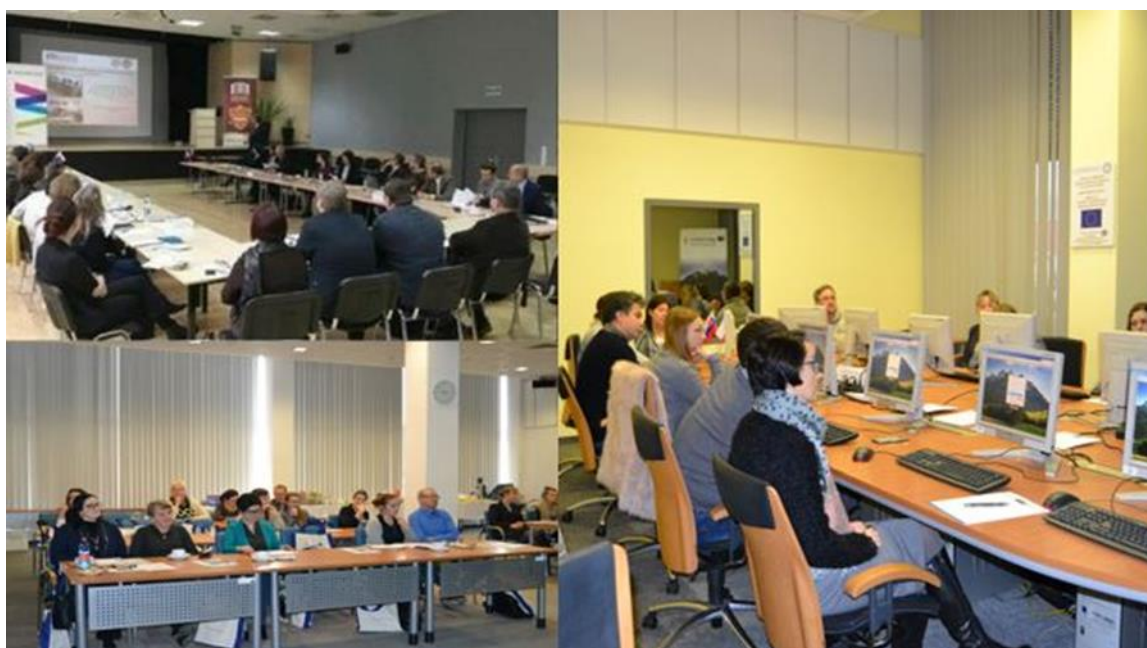
Na zdjęciu szkolenia w Krakowie i Bielsku-Białej.

Osoby biorące udział w szkoleniach zaproszono na spotkania do Krakowa, Rzeszowa, Bielska-Białej, Preszowa i Żyliny. Podczas wspólnych zajęć oraz indywidualnych konsultacji zapoznali się oni z najważniejszymi aspektami realizacji projektów. W większości było to osoby odpowiedzialne za zarządzanie projektami i finansami.