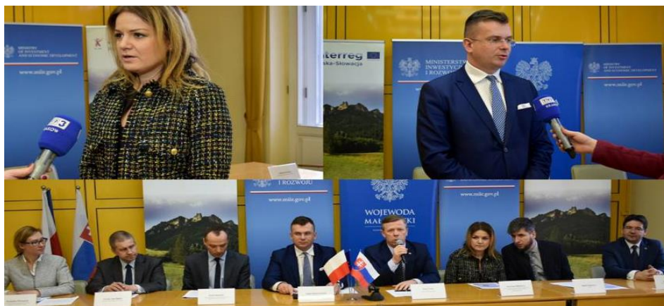
Na zdjęciu uroczyste otwarcie naborów wniosków (Kraków, 5.03.2018).

Jednocześnie w 2018 r. przeprowadzono dwa konkursy na nowe projekty. Równoległe do nich podjęto intensywne działania informacyjno-promocyjne. Ich celem było zachęcenie do udziału w konkursie i przedstawienia pomysłów na działania, które byłyby impulsem do rozwoju transgranicznego transportu między Polską a Słowacją oraz rozwoju edukacji dostosowanej do wymogów rynku pracy pogranicza. Informacje o konkursach ukazywały się w lokalnych mediach po stronie polskiej i słowackiej, na stronach internetowych oraz w mediach społecznościowych.