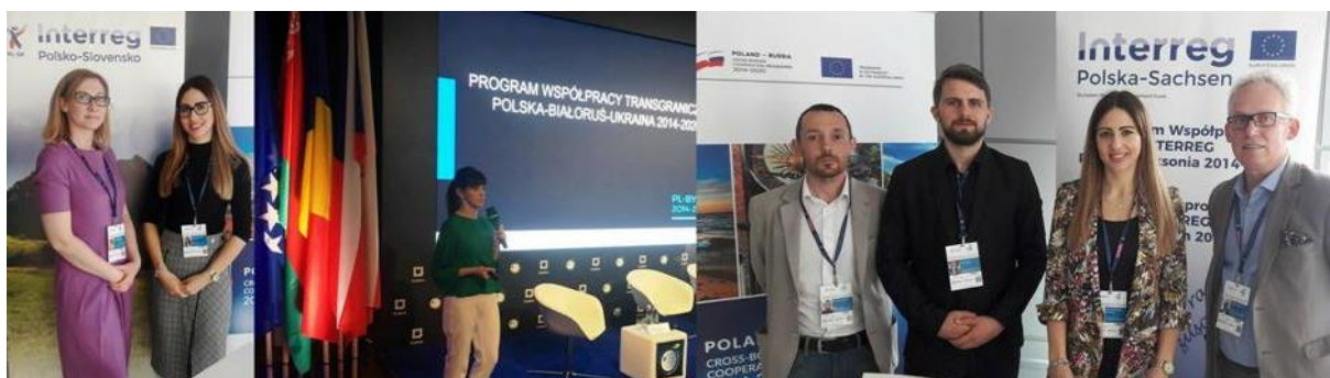
Na zdjęciu IV Europejski Kongres Samorządów w Krakowie, 26-27.04.2018.

Istotnym działaniem promocyjnym programu podczas wspomnianego Forum Ekonomicznego w Krynicy było uczestnictwo w panelu dyskusyjnym poświęconym współpracy transgranicznej. Wyjątkowym wydarzeniem było wręczenie nagród wyróżniającym się projektom karpackim: „Szlak Kultury Wołoskiej” oraz „Karpackie niebo”. Co ciekawe, można już zaobserwować inspirujący wpływ projektów zrealizowanych na powstawanie kolejnych ciekawych inicjatyw. Na przykład projekt „Historyczno-kulturowo-przyrodniczy szlak wokół Tatr” stał się inspiracją dla innego projektu „Torfowiska wysokie - europejski unikat polsko-słowackiego pogranicza”. W jego ramach, oprócz ścieżki rowerowej przebiegającej przez torfowiska, powstały dwa muzea: Centrum Dziedzictwa Przyrodniczego „Muzeum torfowisk” - interaktywne muzeum torfowisk w Chochołowie oraz muzeum przyrodnicze na dziedzińcu Zamku Orawskiego na Słowacji. W konkursie Komisji Europejskiej RegioStars projekt ten wyróżniono jako jedno z najciekawszych, najbardziej oryginalnych i innowacyjnych przedsięwzięć w skali całej Europy.