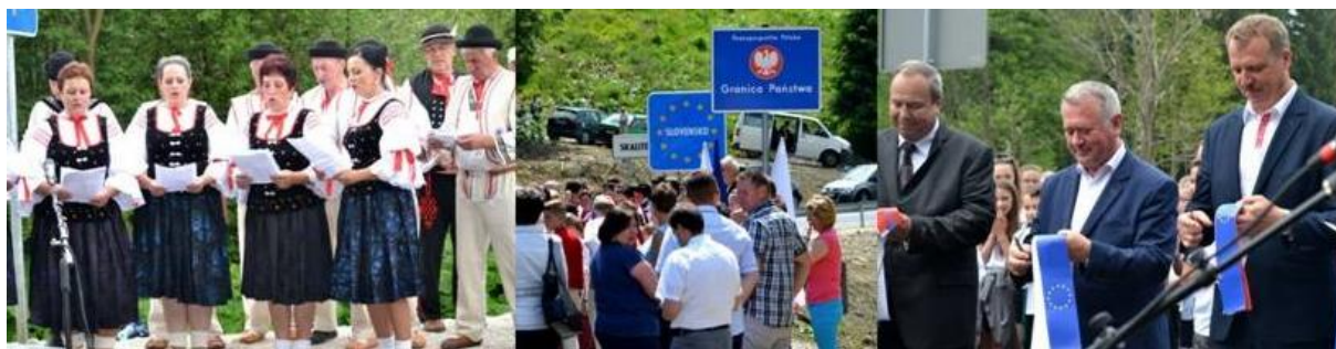
Na zdjęciu uroczyste otwarcie nowego połączenia komunikacyjnego Jaworzynka-Cierne-Skalite, 29.05.2018.

W 2018 roku z sukcesem ukończono kilkanaście projektów z zakresu dziedzictwa przyrodniczego i kulturowego. Ich efektem jest ponad 190 km nowych, zmodernizowanych lub udoskonalonych transgranicznych szlaków rekreacyjnych. Zakończono także realizację siedmiu inwestycji drogowych. W wyniku realizacji tych przedsięwzięć przebudowano lub zmodernizowano ponad 100 km dróg. Ukończono także dwa pierwsze projekty edukacyjne, w ramach których przeprowadzono 21 wspólnych szkoleń, w których wzięło udział około 1560 uczestników.