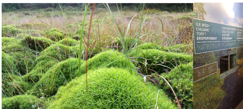
Na zdjęciu projekt „Torfowiska wysokie”.

Istotnym działaniem promocyjnym programu podczas wspomnianego Forum Ekonomicznego w Krynicy było uczestnictwo w panelu dyskusyjnym poświęconym współpracy transgranicznej. Wyjątkowym wydarzeniem było wręczenie nagród wyróżniającym się projektom karpackim: „Szlak Kultury Wołoskiej” oraz „Karpackie niebo”. Co ciekawe, można już zaobserwować inspirujący wpływ projektów zrealizowanych na powstawanie kolejnych ciekawych inicjatyw. Na przykład projekt „Historyczno-kulturowo-przyrodniczy szlak wokół Tatr” stał się inspiracją dla innego projektu „Torfowiska wysokie - europejski unikat polsko-słowackiego pogranicza”. W jego ramach, oprócz ścieżki rowerowej przebiegającej przez torfowiska, powstały dwa muzea: Centrum Dziedzictwa Przyrodniczego „Muzeum torfowisk” - interaktywne muzeum torfowisk w Chochołowie oraz muzeum przyrodnicze na dziedzińcu Zamku Orawskiego na Słowacji. W konkursie Komisji Europejskiej RegioStars projekt ten wyróżniono jako jedno z najciekawszych, najbardziej oryginalnych i innowacyjnych przedsięwzięć w skali całej Europy.